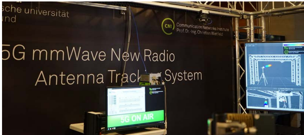
Abbildung 2: Laborexperiment mit mmWave SDR Technologie

Denkbare Arbeitspunkte dieser Arbeit sind: